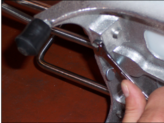
Figura 3. Ajuste del cabezal de empuje a través de las hojas.