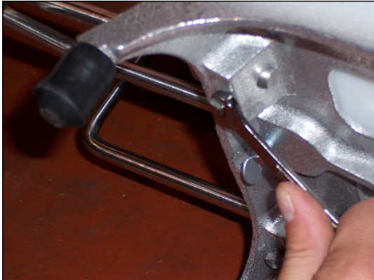
Figure 3. Ajustement de la tête de poussée à travers les lames